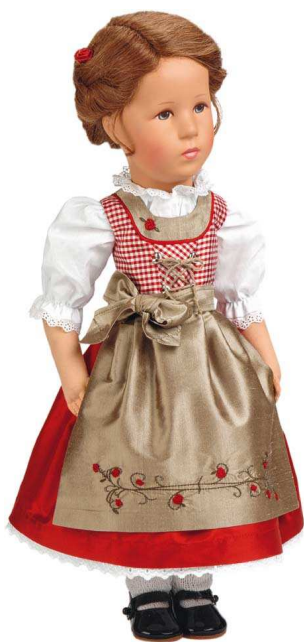
Viktoria 47cm Handgestopft

„Die Neuheiten 2016 sind eingetroffen“ Wir laden Sie von 11,30 – 16 00 Uhr ins Museum nach Kevelaer Hauptstr. 18 ein. Erstmals bieten wir Ihnen Gelegenheit, die Neuheiten 2016 nicht nur zu bestaunen. Gerne können Sie die neue, sehr gelungene krusische Kollektion erwerben oder bestellen. Für diese Sonderveranstaltung übernehmen wir den Eintritt ins Museum.